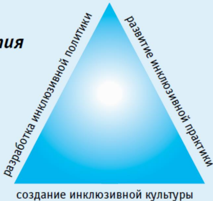
Рис. 3. Три аспекта развития Инклюзии: